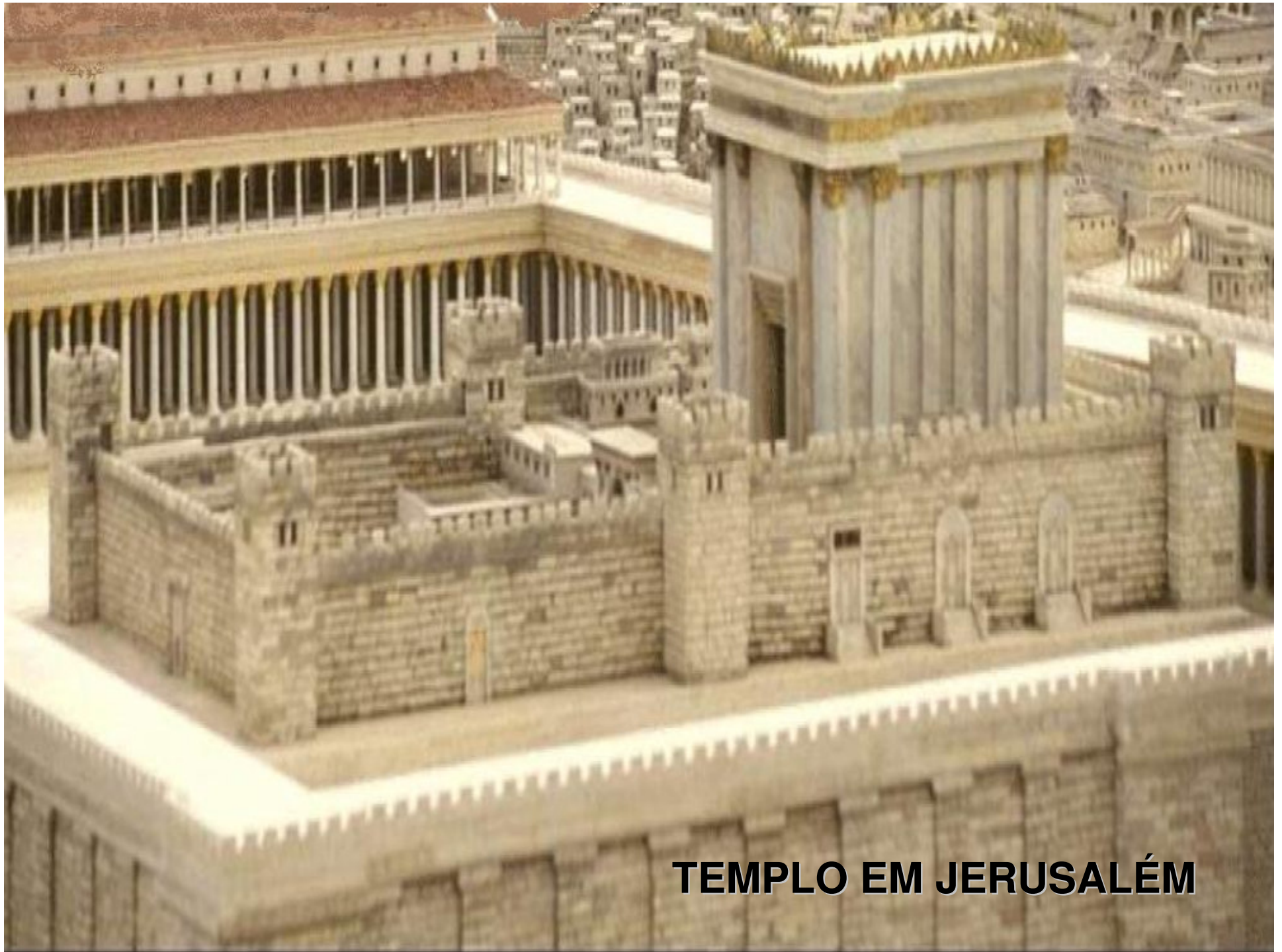
TEMPLO EM JERUSALÉM