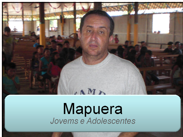
Mapuera Jovens e Adolescentes