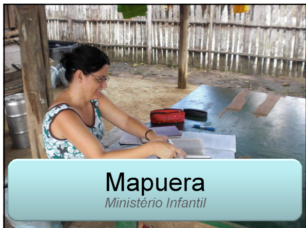
Mapuera Ministério Infantil